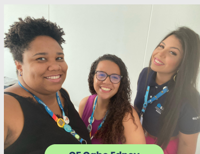
CF Cabo Edney