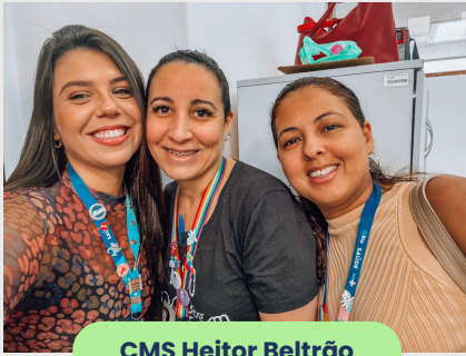
CMS Heitor Beltrão