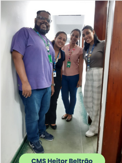
CMS Heitor Beltrão