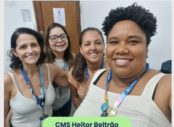
CMS Heitor Beltrão