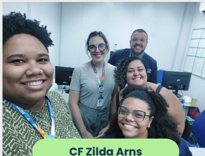
CF Zilda Arns