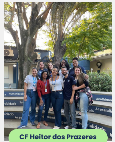
CF Heitor dos Prazeres